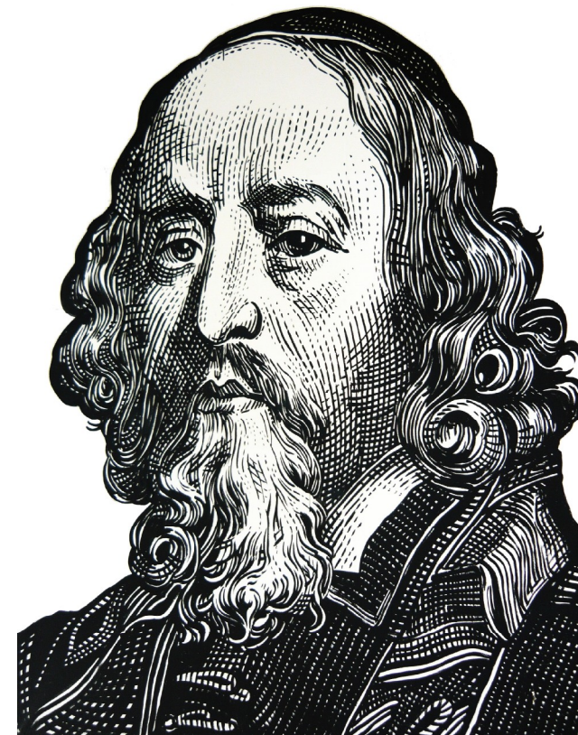
Jan Amos Komenský